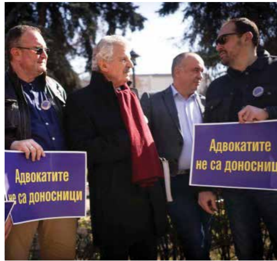
Опозицията в професионалната общност обяви готовност за стачка