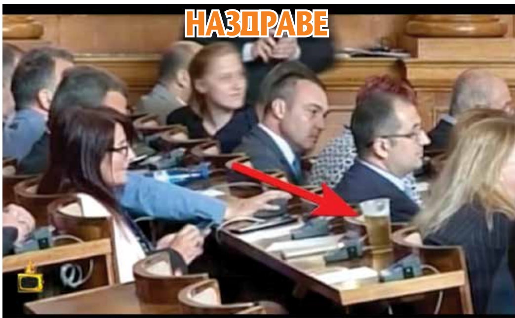
Народните представители си пийват биричка по време на заседанията на НС....