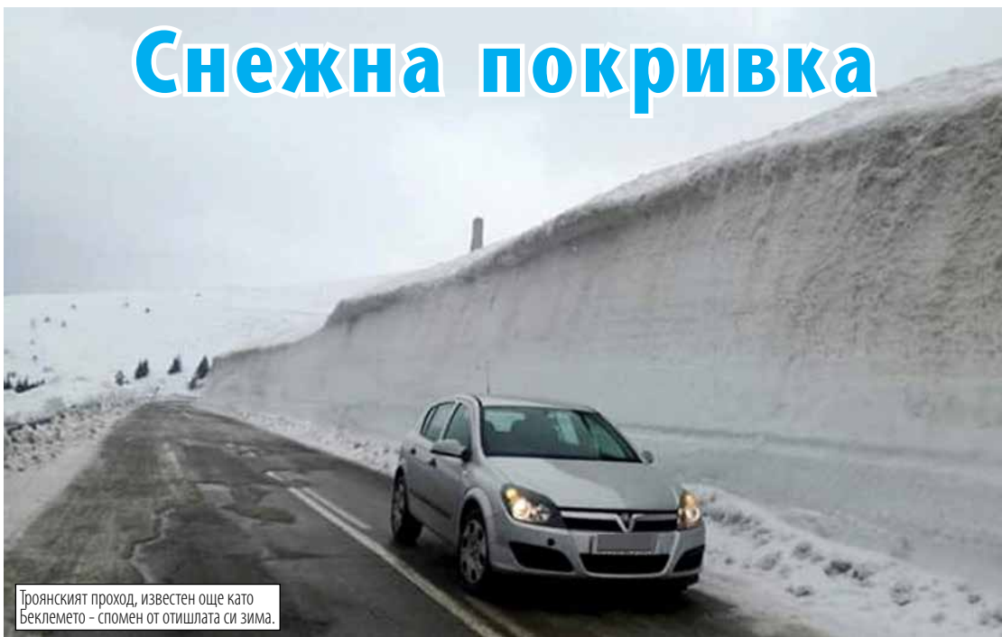
Троянският проход, известен още като Беклемето – спомен от отишлата си зима.