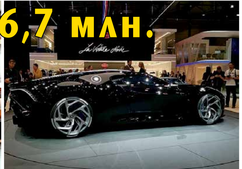
Бугати показа в Женева най-скъпия автомобил в света. Цената на новият модел La Voiture Noire - Черната кола, е умопомрачителна. От нея има само една-единствена бройка, а автомобилът е изработен специално за 110-годишнината на Bugatti. Има сложен, 16-цилиндров двигател с 4 турбо компресора, който дава мощност от 1149 конски сили. Производителят твърди, че максималната скорост на колата е 420 км/ч.