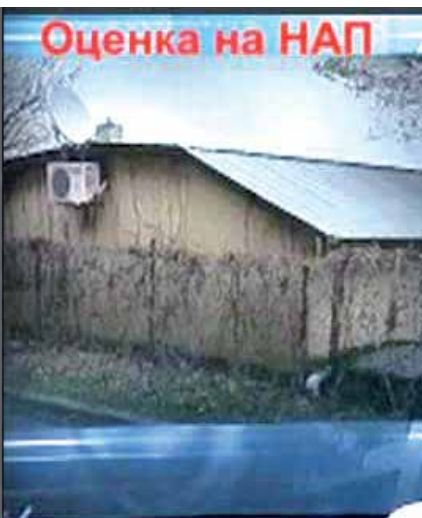
Оценка на НАП

Апартаменти на Цв. Цветанов: 600 евро КВ. М.