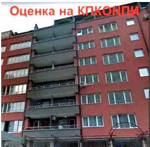
Оценка на КПКОНПИ

Апартаменти на Цв. Цветанов: 600 евро КВ. М.