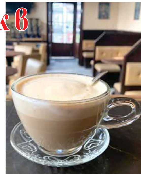
Преди 40 г. същото