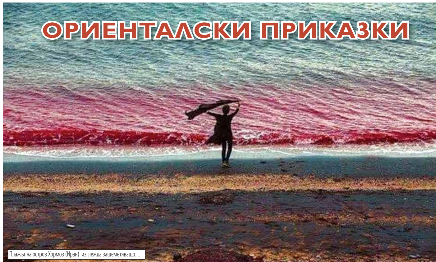
Плажът на остров Хормоз (Иран) изглежда зашеметяващо....