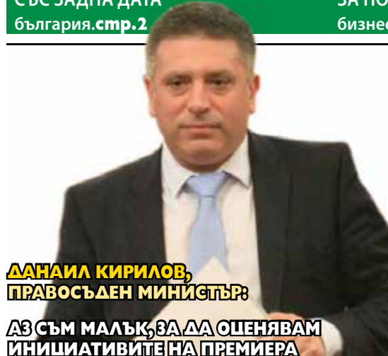
ДАНАИЛ КИРИЛОВ, ПРАВОСЪДЕН МИНИСТЪР:

АЗ СЪМ МАЛЪК, ЗА ДА ОЦЕНЯВАМ ИНИЦИАТИВИТЕ НА ПРЕМИЕРА