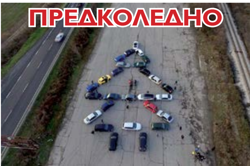
Нестандартна елха от коли направиха младежи на полигон край Благоевград. Шофьорите са се организирали в социалните мрежи и са се заели с атрактивната задача.