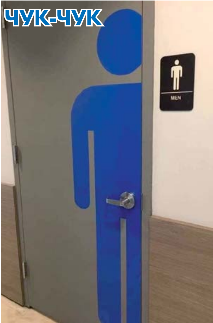
Дръжката на тази врата за мъжката тоалетна е поставена на точното място