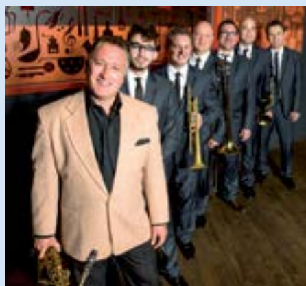
градове, които ще сложат обувките за суинг за една приказна вечер.

Кръстникът на суинга идва в София за първи път. Легендарният Рей Джелато, поставил този стил в центъра на прожекторите от 80-те до днес, ще бъде в България на 12 март. Английският джаз певец и тенор саксофонист ще завърти Sofia Live Club в суинг, джайв и блус ритъм под музикалния съпровод на незаменяемия си бенд - The Giants. Заедно възвращат интереса към винтидж джаз и суинг ерата с толкова модерно звучене, че сънените класики на 20-те оживяват по нов, магичен и мащабен начин из цяла Америка, а малко след това в целия свят. През 2020 г. кръстникът на суинга отбелязва 25-годишния юбилей на бенда с нов албум, а София е сред първите