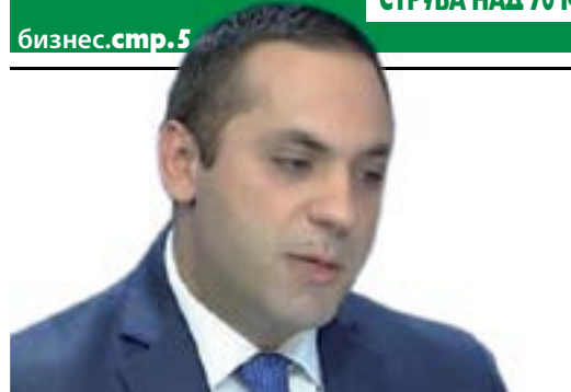
ЕМИЛ КАРАНИКОВ, МИНИСТЪР НА ИКОНОМИКАТА:

РАЗЧИТАМ НА ПРИРОДАТА И ВЯРВАМ, ЧЕ ШЕ НАПЪЛНИ ЯЗ. СТУДЕНА