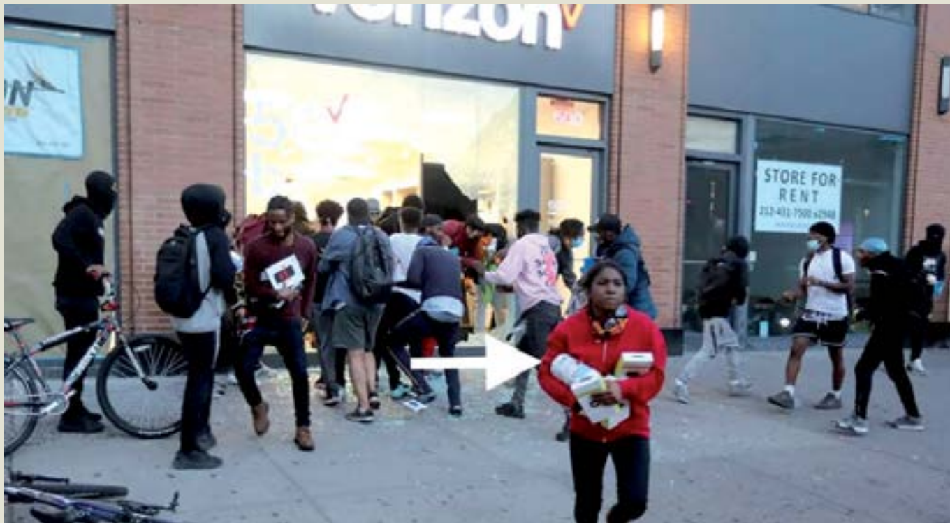
Протестите за граждански права на интелигентни млади хора, мирни и красиви, както ги описва CNN, се подсигуриха и с тоалетна хартия, докато разбиват магазини в САЩ.