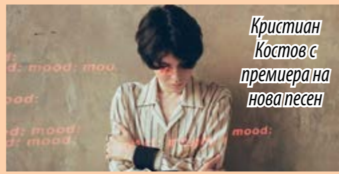
Кристиан Костов с премиера на нова песен

Кристиан Костов ще направи премиера на видеото към песента си Things I Like. Първоначалните планове бяха то да се появи на бял свят днес. Това обаче ще се случи на 12 юни, а в причина за това се превърнаха протестите в САЩ. „Чувствам, че трябва да дам пространство, за да могат да бъдат чути гласовете на хората, които имат нужда от това сега. За мен е разочароващо –знаете, че чакам повече от половин година, за да пусна музика, но има неща, които са по-важни сега и наистина вярвам, че тази една седмица няма да повлияе на кариерата ми“, гласи част от коментара на певица, класирал ни на рекордното второ място на Евровизия, в социалните мрежи.