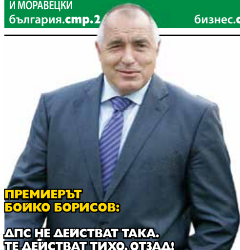
ПРЕМИЕРЪТ БОЙКО БОРИСОВ:

ДПС НЕ ДЕЙСТВАТ ТАКА. ТЕ ДЕЙСТВАТ ТИХО. ОТЗАД!