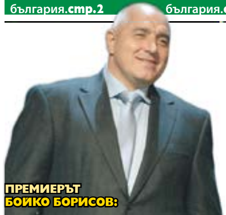
ПРЕМИЕРЪТ БОЙКО БОРИСОВ:

ПРЕЗ ЛЯТОТО УМНО ПУСНАХМЕ ВИРУСА ДА ВИЛНЕЕ В БЪЛГАРИЯ