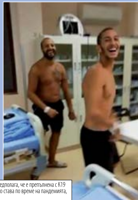
Видео, в което млади роми играят кючек в болница, която се предполага, че е препълнена с К19 тежки случаи, бе разпространено в социалните мрежи. Ето какво става по време на пандемията, са само част от коментарите под клипа.