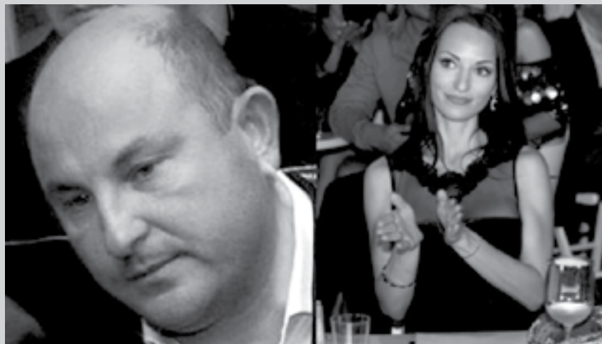
ИМЕТО НА БАЩАТА НА ДЕТЕТО НА МИС ГЕРБ СЕ ПАЗИ В РЕДАКЦИЯТА

СКИ ЗАТВОР ЗА ТРАФИК НА ДРОГА, ДА ПОМЕТЕ ВСИЧКИ И ДА ВЛЕЗЕ В НОВИЯ ПАРЛАМЕНТ. ПОЛОВИНКАТА НА НОВОИЗБРАННАТА ДЕПУТАТКА СЛАВЕНА ТОЧЕВА, ОТ КОГОТО ТЯ ИМА ДЕТЕ, Е МЕЖДУНАРОДЕН ПЛАСЪОР НА НАРКОТИЦИ. ПРЕДИ НЯКОЛКО ГОДИНИ ТОЙ Е ЗАЛОВЕН „НА КАЛЪП“ С ГОЛЯМО КОЛИЧЕСТВО ДРОГА И Е ПРАТЕН В ИСПАНСКИ ЗАТВОР, КЪДЕТО И В МОМЕНТА ИЗЛЕЖАВА 11-ГОДИШНА ПРИСЪДА“.