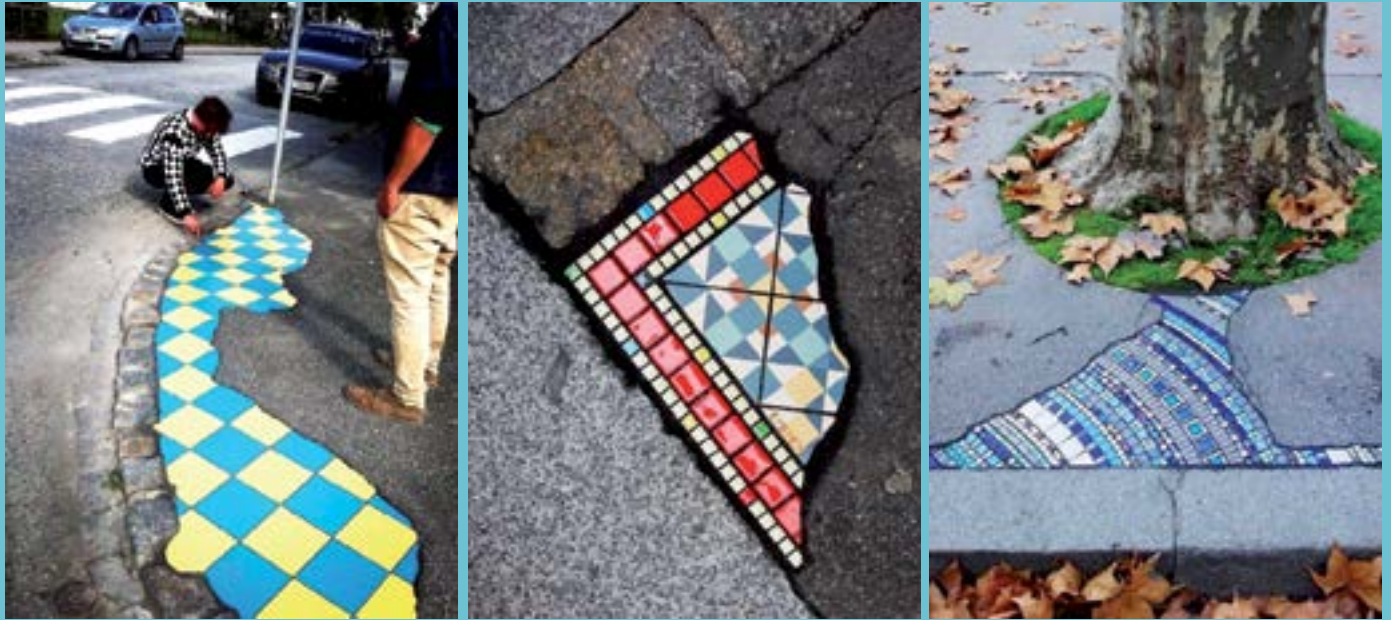
Не само в София има проблеми с разбити тротоари. В Лион художник с псевдоним Емем запълва дупки и разрушени тротоари с мозайки. Мъжът го нарича изкуството на флопирането - пълненето на тротоарите с малки цветни керамични плочки. Във Франция той е наречен хирург на тротоара, който лекува раните на градските улици от 2016 г.