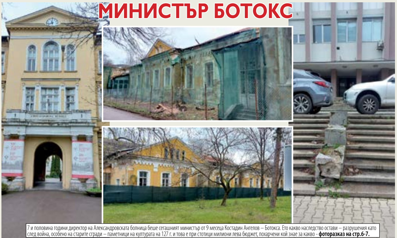
7 и половина години директор на Александровската болница беше сегашният министър от 9 месеца Костадин Ангелов – Ботокс. Ето какво наследство остави – разрушения като след война, особено на старите сгради – паметници на културата на 127 г. и това е при стотици милиони лева бюджет, похарчени кой знае за какво - фоторазка на стр.6-7.