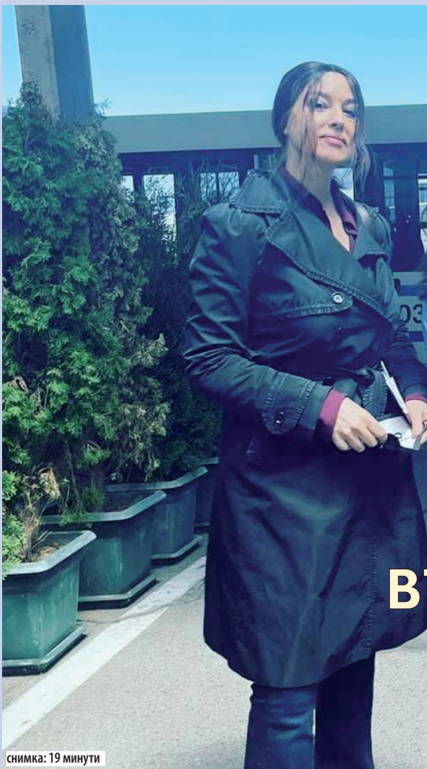
Снимка: 19 минути