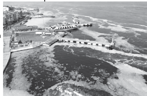
Валя Ахчиева | EURACTIV BULGARIA

Огромна слустеста маса заплашва екологията на Черно море откъм Турция, алармира украинският сайт Страна.уа. Очаква се катастрофа, тъй като течността с вид на слюнка всъщност е продукт на замърсяване от неочистени тръби, бълващи мръсотия. В момента мащабното петно върви от Мраморно към нашето море и е толкова голямо, че се наблюдава дори от голяма височина във въздуха. Сайтът цитира ВВС, че от 15 г. вече има такива проблеми, свързани с бурното и невинаги регламентирано строителство в Истанбул, но сегашният размер е рекордно голям в историята, което вероятно ще се умножи като ефект с градежа на канала между Мраморно и Средиземно море, заобикалящ Босфора, а стартът му е този месец. Специални бригади са се заели с неутрализиране поне на част от петното при Фатса, провинция Орду. Лично президентът Ердоган коментира: „Надявам се да спасим нашето море от тази напасть. Но се боя, че тя ще се разпространи в Черно море. Ако това стане, ще имаме голям проблем“.