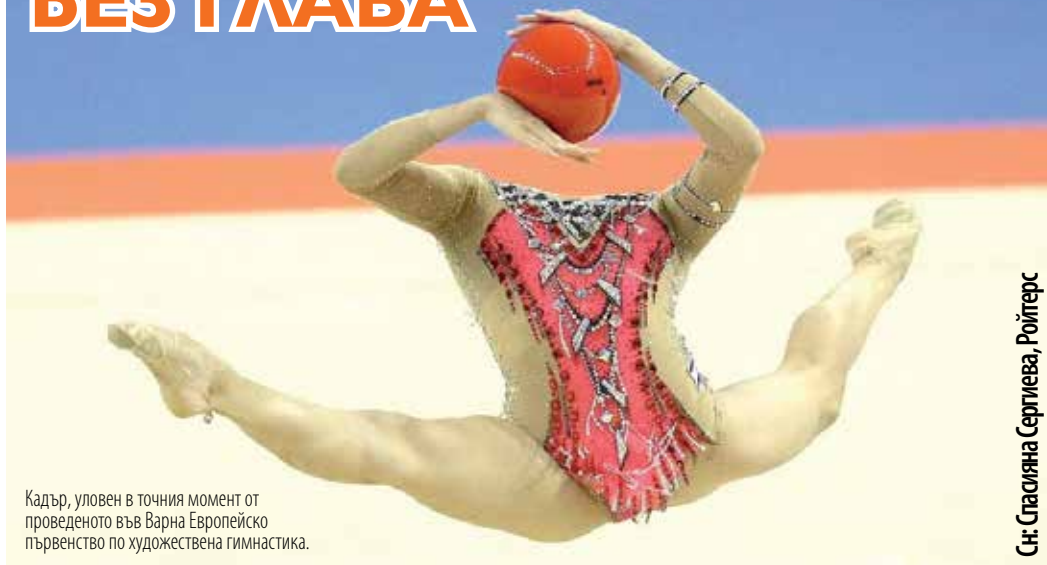
Кадър, уловен в точния момент от проведеното във Варна Европейско първенство по художествена гимнастика.