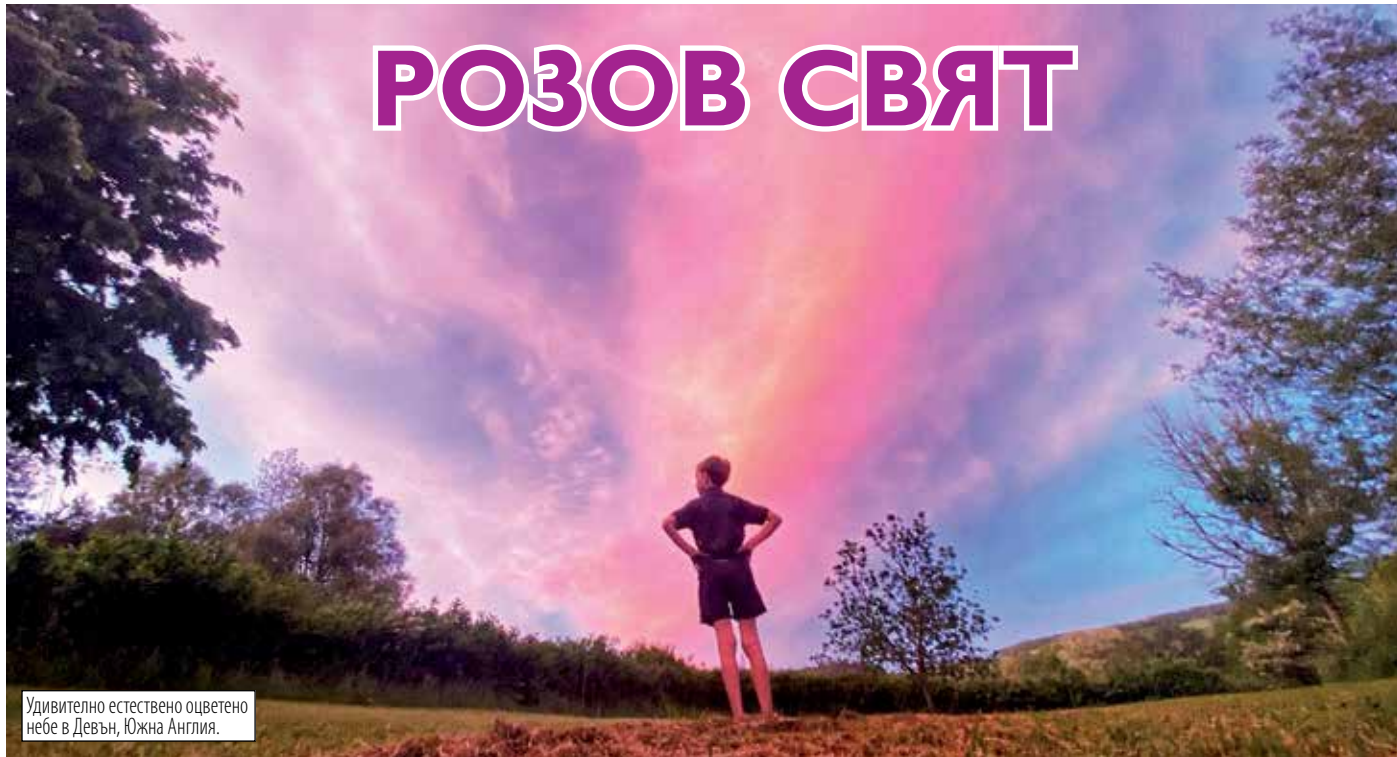
Удивително естествено оцветено небе в Девън, Южна Англия.