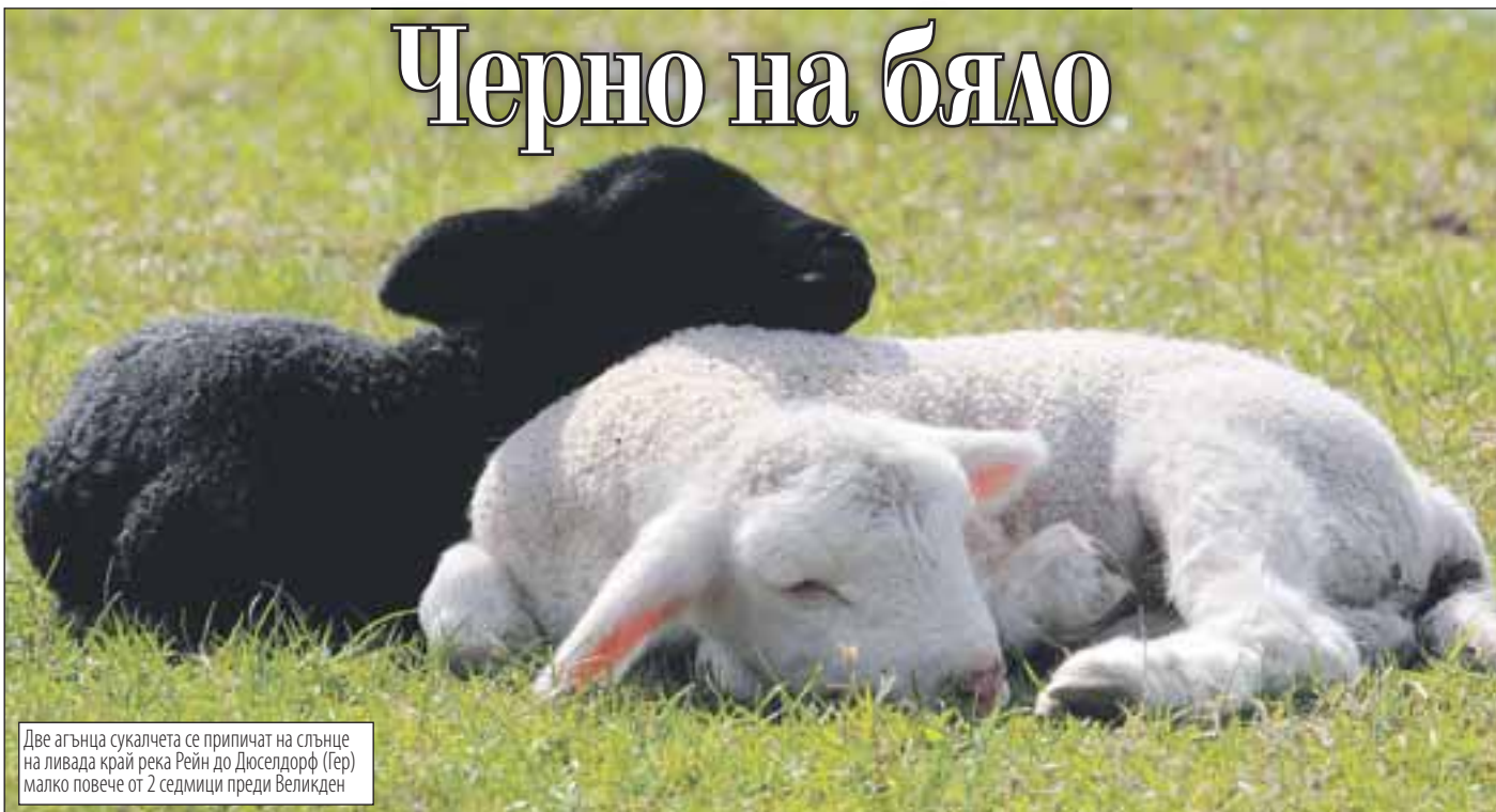
Две агънца сукалчета се припичат на слънце на ливада край река Рейн до Дюселдорф (Гер) малко повече от 2 седмици преди Великден