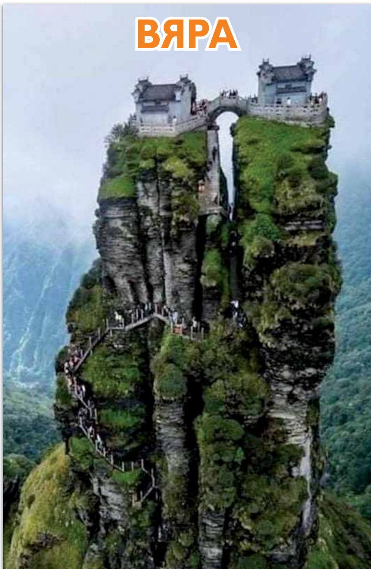
Това е будистки храм на върха на планината Фанджинг в провинция Гуйдзюу (Китай)