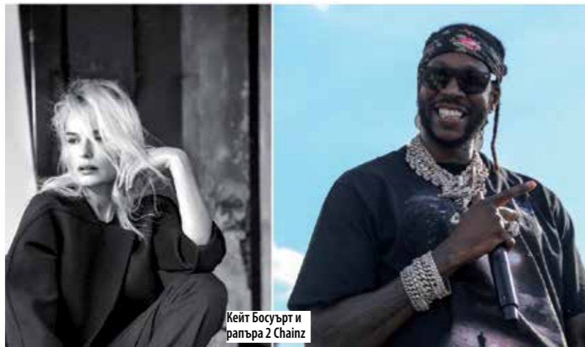
Кейт Босуърт и рапърът 2 Chainz

Италианската маестра Джанна Фратта застава начело на националния оркестър на 8 юли от 20 ч. в Парк-театър Борисова градина. В първия концерт от летния сезон на Софийската филхармония ще звучи италианска филмова музика от всепризнатите гении Нино Рота и Енио Мориконе. Концертът, посветен на 100-годишнината на Федерико Фелини, имаше огромен успех през ноември 2020, а зала България не може да побере желаещите да се насладят на музиката, спомогнала за успеха на култови филми като Сладък живот, Амаркорд, Гепардът, Осем и половина, Ново кино Парадизо и други. Летният сезон на Софийската филхармония Споделете музиката е подкрепен от Столична община и е част от Културния календар на София. Джанна Фратта е сред най-известните диригенти на Италия. През тази година тя бе назначена за директор на Сицилианския симфоничен оркестър.