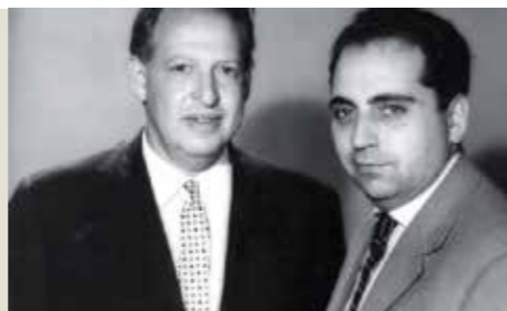
Братя Мормареви започват с общи фейлетони във вестник Стършел.

култовите български филми, както за деца, така и за възрастни, сред които Старинната монета, Таралежите се раждат без бодли, Войната на таралежите, С деца на море, Двойникът, Изпити по никое време, Два диоптъра далекогледство, 13-ата годишнина на принца и други. БНР е мястото, където Мориц и Марко стават Братя Мормареви. В началото на филмовата им кариера много хора наистина мислят, че те са кръвни бра-