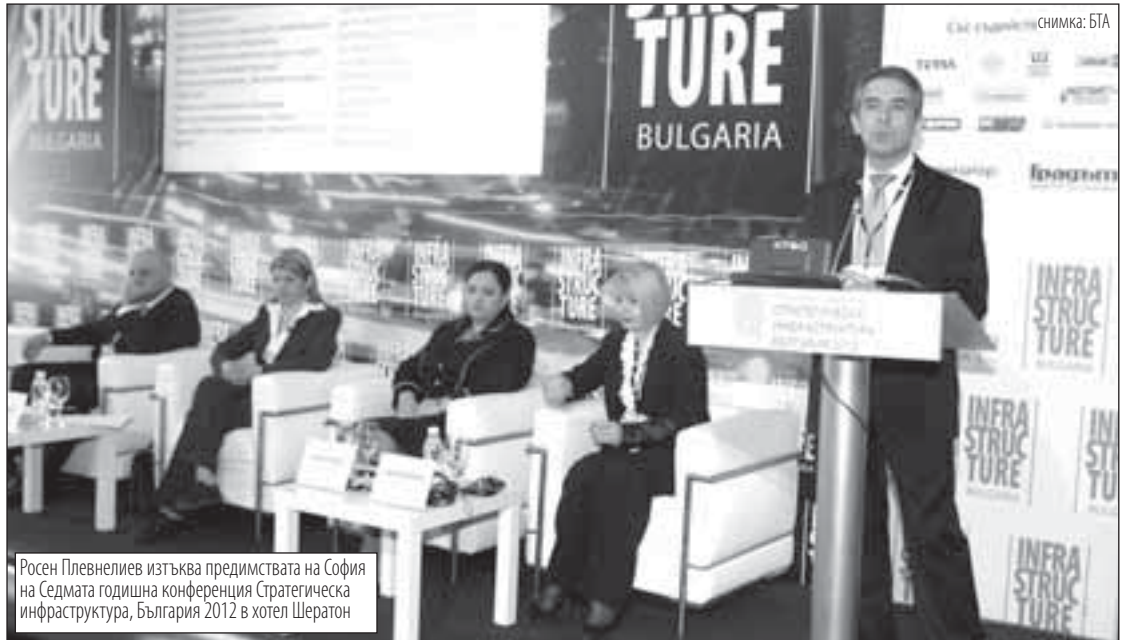
Росен Плевнелиев изтъква предимствата на София на Седмата годишна конференция Стратегическа инфраструктура, България 2012 в хотел Шератон