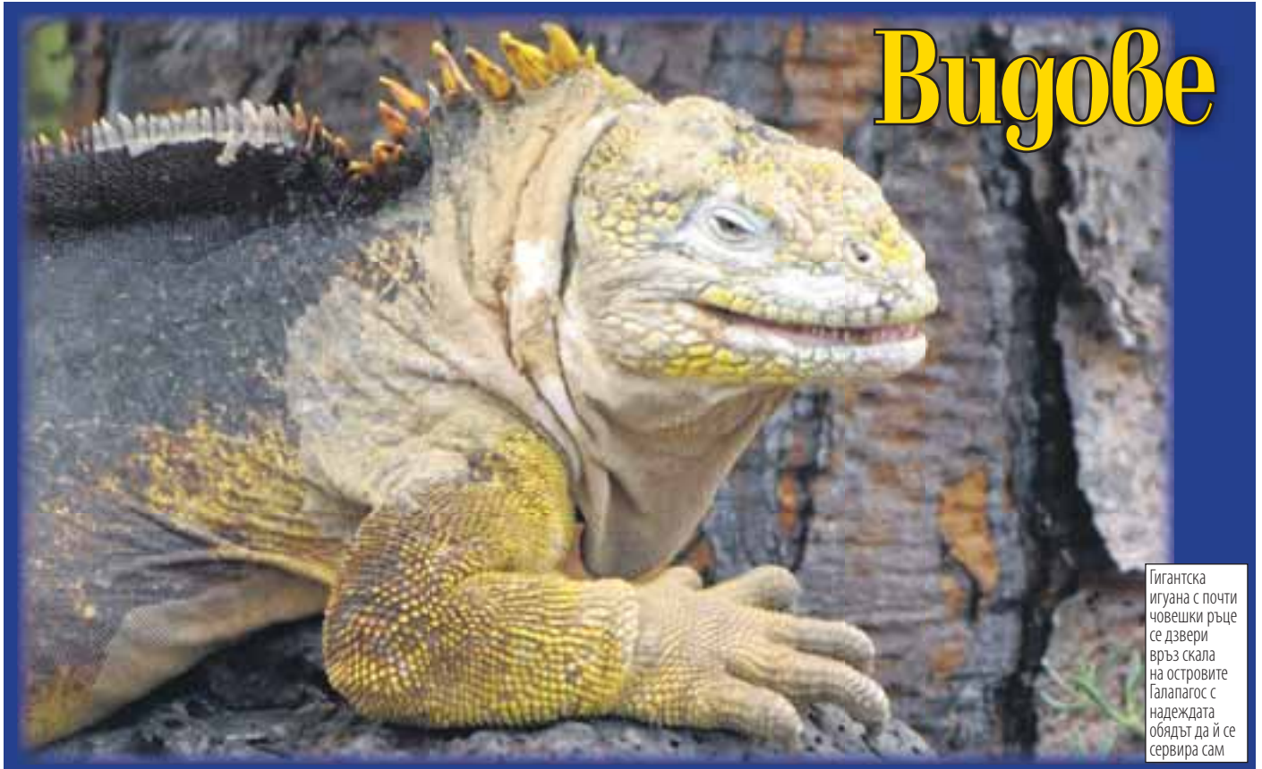
Гигантска игуана с почти човешки ръце се дзвери връз скала на островите Галапагос с надеждата обядът да ѝ се сервира сам