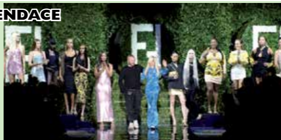
Амбър Валета, Джиджи Хадид. На ревиюто присъстваха много известни личности, сред които Деми Мур, Дуа Липа и Елизабет Хърли.

ния за конкурентната модна къща стил с пънк рок елементи и интерпретация на използваната от бранда ѝ глава на медуза. Тя нарича проекта чудесен творчески диалог. Колекциите бяха представени на модния подиум от Кейт Мос, Наоми Кемпбъл,