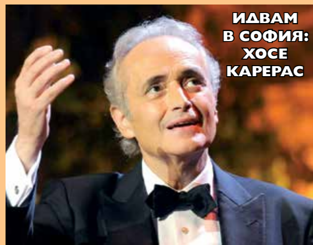
ИДВАМ В СОФИЯ: ХОСЕ КАРЕРАС

Хосе Карерас потвърди новината, излязла първо в 19' в началото на месеца, че идва в София за световната премиера на новия си галаспектакъл Орега D'Amore в зала Арена Армеец. Тенорът-легенда ще пее за любовта на 19 декември, точно година след първоначално отложения първи спектакъл на тази дългоочаквана супермодерна продукция. С Карерас на сцената излиза елитен състав от световноизвестни български и чуждестранни оперни артисти. Сред тях са руската мегазвезда Мария Гулегина, легендата на Ла Скала