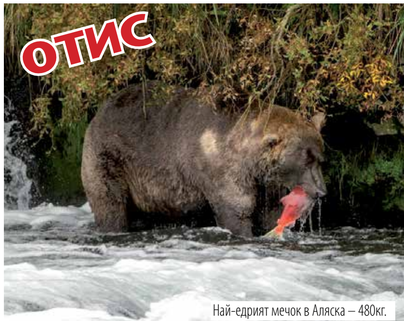
Най-едрият мечок в Аляска – 480кг.

Онзи ден когато фей- сът се срина в про-