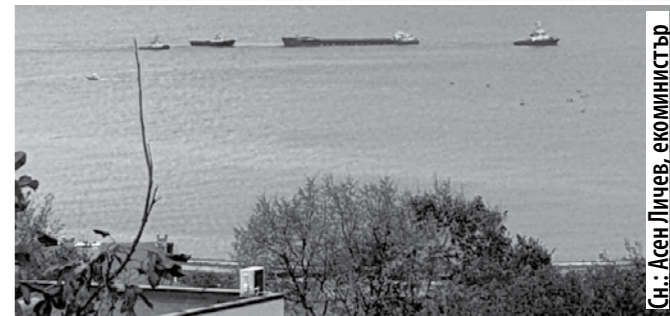
Сн. Асен Личев, екоминистър

близо до брега. Ще се иницират законови идеи за това как страната да се снабди с техника, тъй като нямаме никаква готовност за подобен вид операции. По думите на транспортния министър държавата поема собствеността на Вера Су и корабът няма да бъде нарязан на скрап.