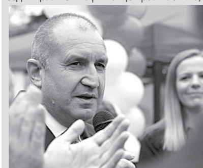
КУПУВАНЕТО И ПРОДАВАНЕТО НА ГЛАСОВЕ Е ПРЕСТЪПЛЕНИЕ!

„Навлизнаме в последната предизборна седмица. В нея мафията ще прави всичко,