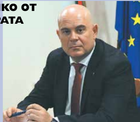
ната прокуратура в Плевен. Към проверката по сигнала на

са снимали и разпространили чата на главния прокурор, са извършили престъпление, защото са погазили тайната на кореспонденцията му. Това са основните изводи от постановлението на прокурора Венцислав Фердинандов. Той се е произнесъл скоростно по сигнала на БОЕЦ - само за 13 дни. От 25 октомври Фердинандов е зам.-шеф на Окръж-