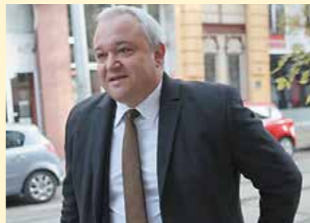
дал Осемте джуджета - разследване на Антикорупционния фонд.