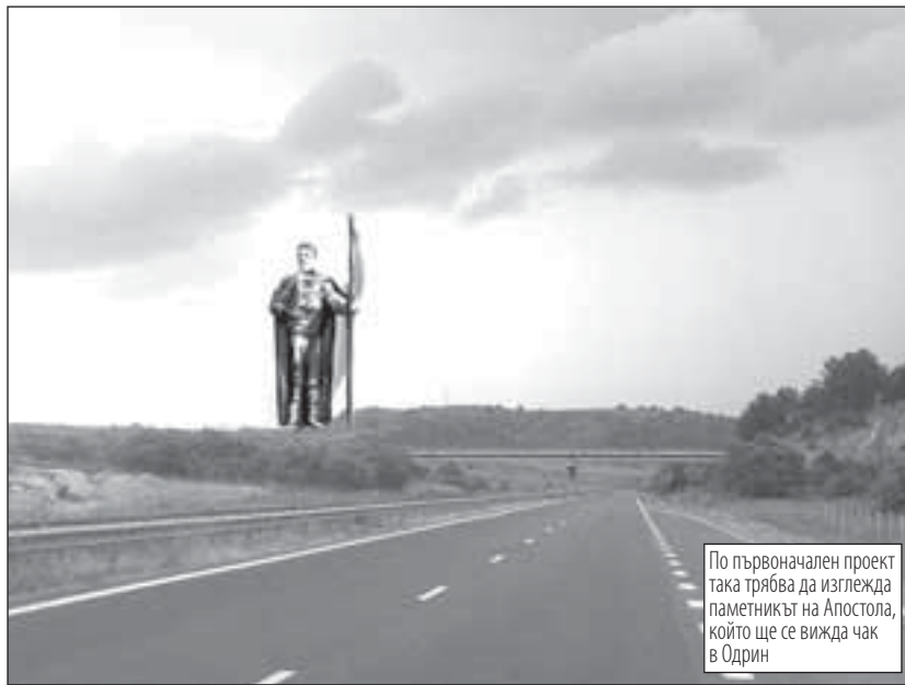
По първоначален проект така трябва да изглежда паметникът на Апостола, който ще се вижда чак в Одрин

Бронзовият патриотичен мемориал е 5 пъти по-висок от 6-ото чудо на света и Статуята на Свободата, ще се вижда в Турция