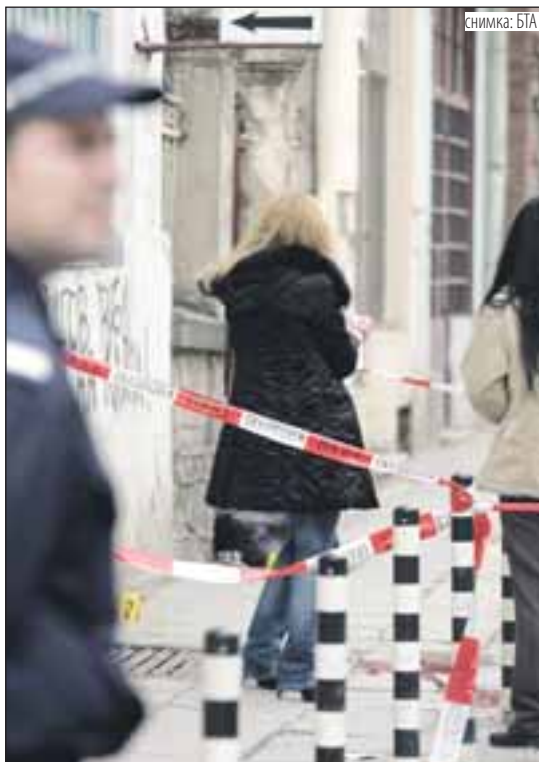
Полиция и следователи отцепиха мястото на инцидента на тъгъла на ул. Будапеща и Кирил и Методий. След разстрела там остана зловеща локва кръв и гилзи