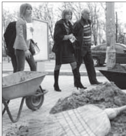
Кметът на София Йорданка Фандъкова провери изпълнението на проекта за реконструкция на пешеходното пространство по бул. Цар Освободител между СУ и Орлов мост

категорична, че агресивните и болни кучета нямат място на улицата и трябва да бъдат приспивани. Като основен проблем Фандъкова отново посочи необходимостта промяна на Наредбата за изграждане на приюти, за да може до няколко месеца да се направи направим приют от отворен тип. Това ще доведе