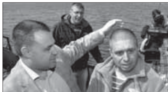
Министърът на земеделието и храните Мирослав Найденов лично посрещна в морето риболовния кораб БЧ 5159, чийто екипаж беше задържан преди година в Румъния за браконьерство

След като във вторник призова сами да си месим козунаците за Великден, вчера земеделският министър Мирослав Найденов разкри, че и той ще запретне ръкави, за да си приготви от сладкиша. „Мога да меся козунак, как е възможно българските дами да не умеят?",