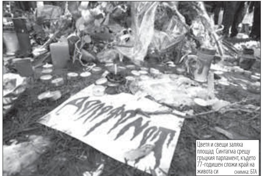
Цветя и свещи заляха площад Синтагма срещу гръцкия парламент, където 77-годишен сложи край на живота си