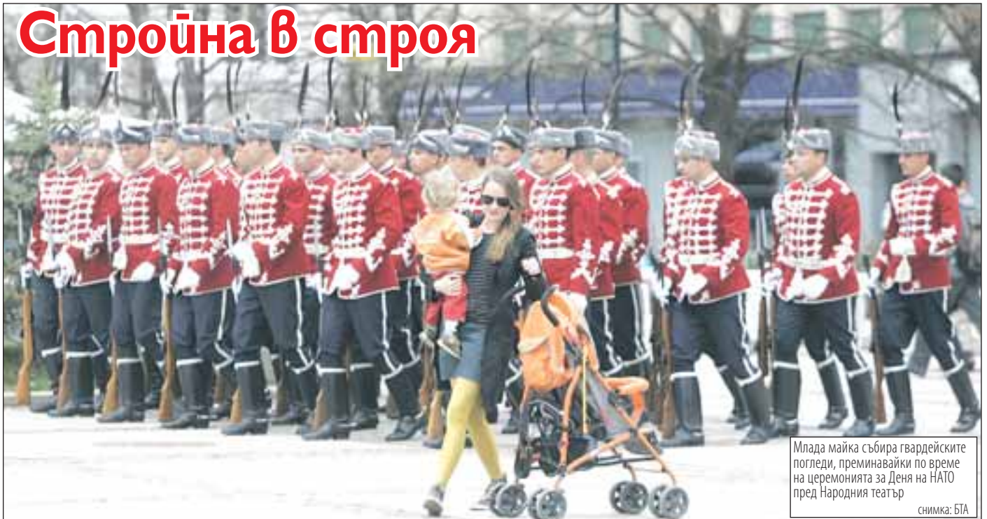
Млада майка събира гвардейските погледи, преминавайки по време на церемонията за Деня на НАТО пред Народния театър