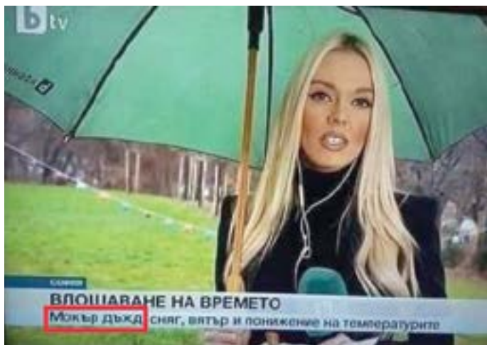
ВЛОЩАВАНЕ НА ВРЕМЕТО Мокър дъжд, сняг, вятър и понижаване на температурите