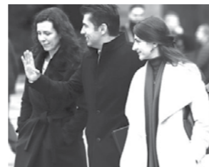
Волт в ПП.