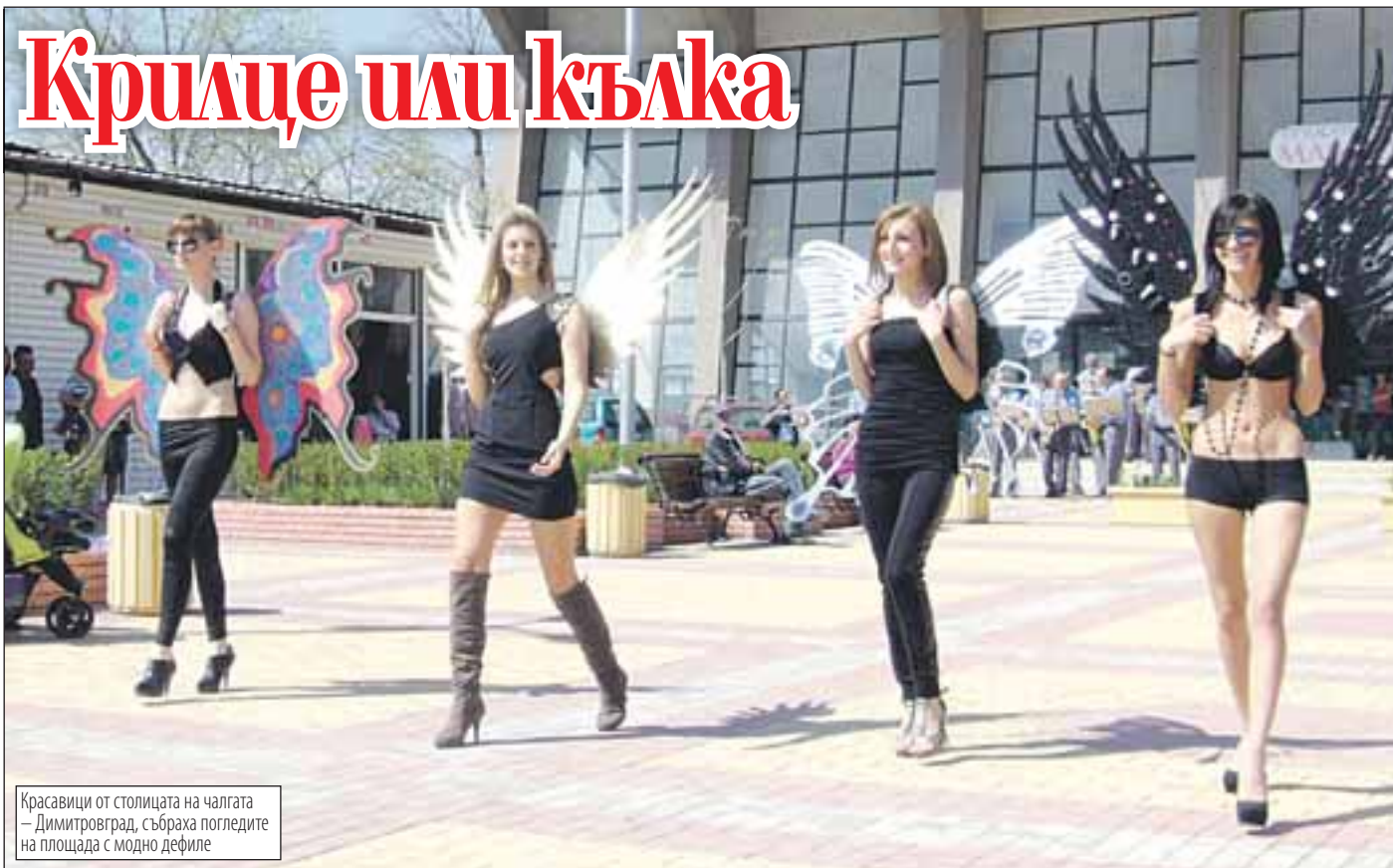
Красавици от столицата на чалгата – Димитровград, събраха погледите на площада с модно дефиле