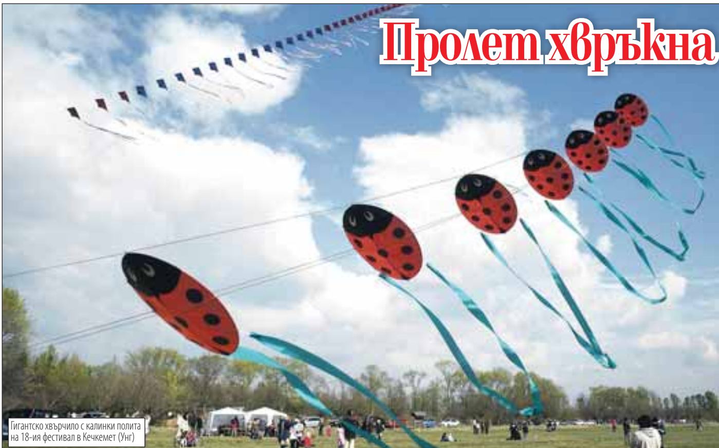
Гигантско хвърчило с калинки полита на 18-ия фестивал в Кечкемет (Унг.)