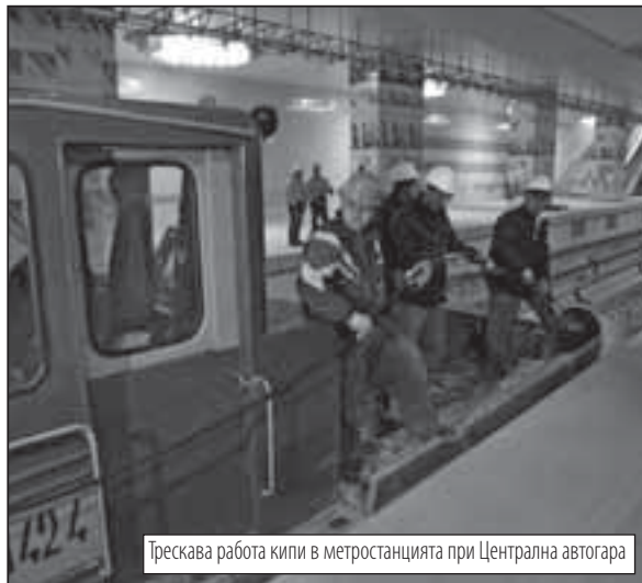
Трескава работа кипи в метростанцията при Централна автогара

Закрит паркинг за 1215 коли под булеварда отваря заедно с железницата