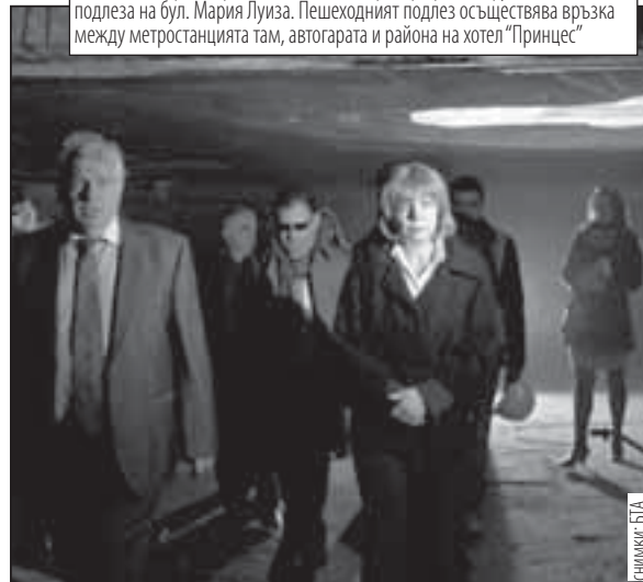
Кметът на София Йорданка Фандъкова провери реконструкцията на подлеза на бул. Мария Луиза. Пешеходният подлез осъществява връзка между метростанцията там, автогарата и района на хотел "Принцес"