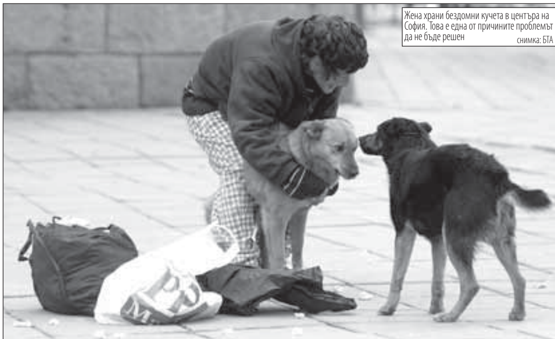
Жена храни бездомни кучета в центъра на София. Това е една от причините проблемът да не бъде решен