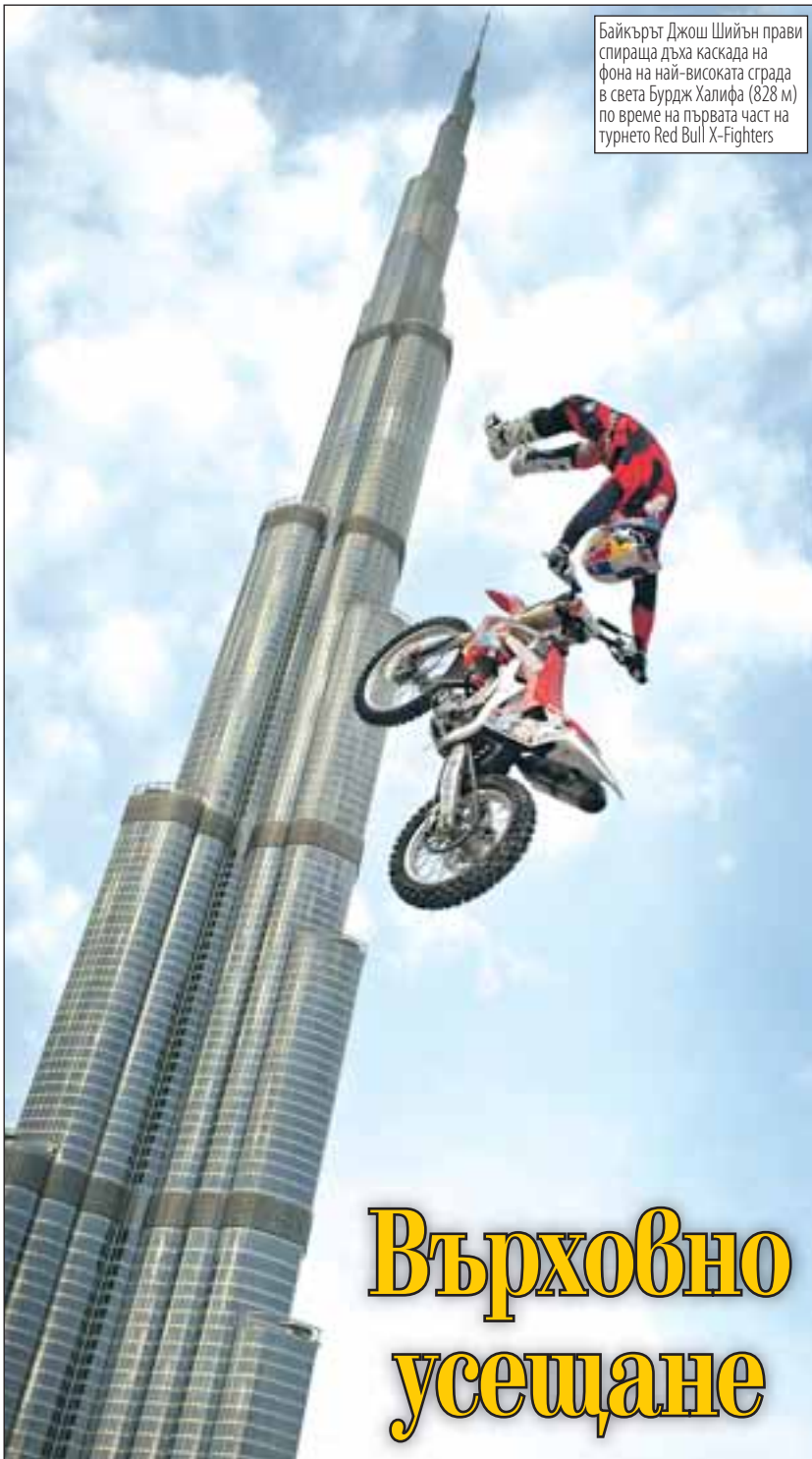
Байкърът Джош Шийън прави спираща дъха каскада на фона на най-високата сграда в света Бурдж Халифа (828 м) по време на първата част на турнето Red Bull X-Fighters