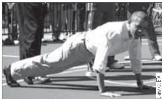
44-ият президент на САЩ Барак Обама прави лицеви опори по време на баскетболен мач на южната моравна на Белия дом по повод Великден

Единственият сериозен конкурент на сега действащия президент на САЩ Барак Обама на изборите на 6 ноември фактически остана бившият губернатор на Масачузетс Мит Ромни. Ден по-рано стана ясно, че републиканецът и краен консерватор Рик Санторум обявява, че напуска кандидат-президентската надпревара. След напускането му, във вътрешно партийната гонка продължават да