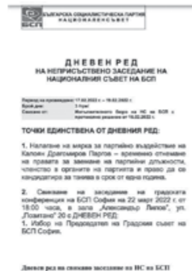
Дневен ред на онлайн заседание на НС на БСП

Самият Паргов обаче дори не присъства физически на въпросното заседание и не гласува, а именно това е основното обвинение срещу него. При ясно мнозинство той не би и променил нищо. Освен това, според