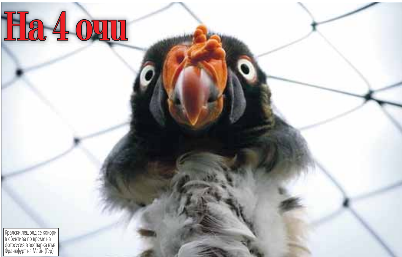
Кралски лешояд се кокори в обектива по време на фотосесия в зоопарка във Франкфурт на Майн (Гер)