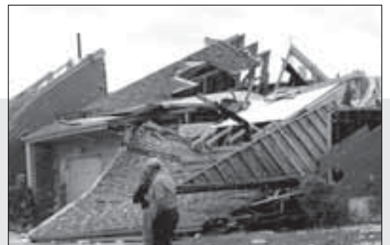
Жители на Айова оглеждат щетите след опустошителното торнадо, което връхлетя САЩ и уби 5-има души

Малко по-късно се разбра, че терористът е преминал обучение в нашата база. Той бил обучаван от българските войници като част от съвместните екипи за връзка между нашата и афганистанска армия.