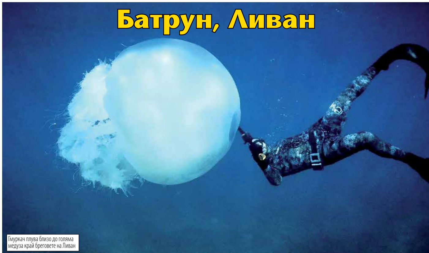
Гмуркач плува близо до голяма медуза край бреговете на Ливан