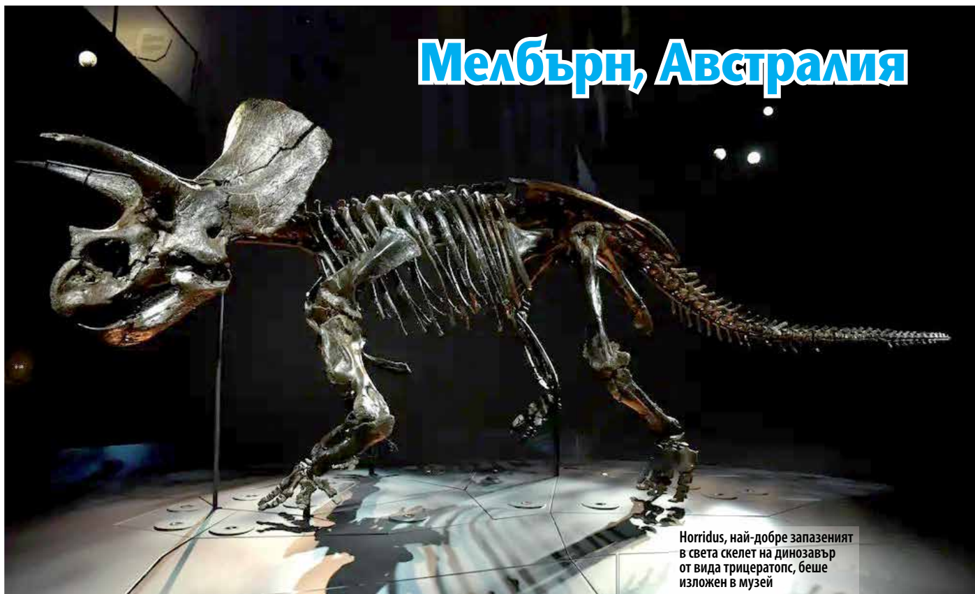
Horridus, най-добре запазеният в света скелет на динозавър от вида трицератопс, беше изложен в музей