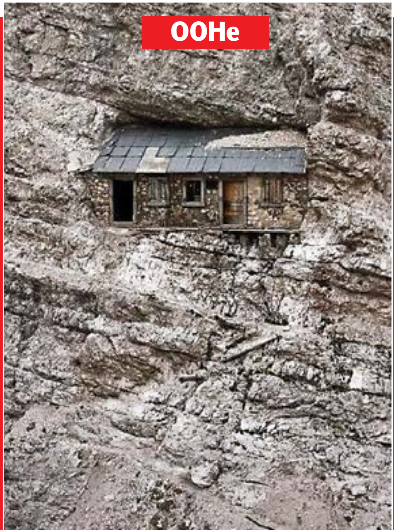
Заслон в скалите под връх Кристало, 2760 м, край Белуно, Италия