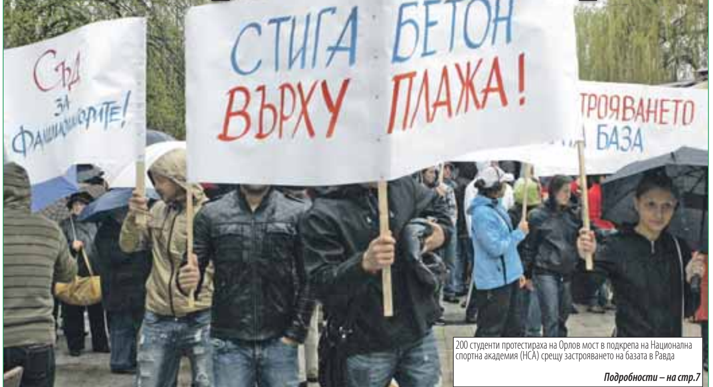
200 студенти протестираха на Орлов мост в подкрепа на Национална спортна академия (НСА) срещу застрояването на базата в Равда