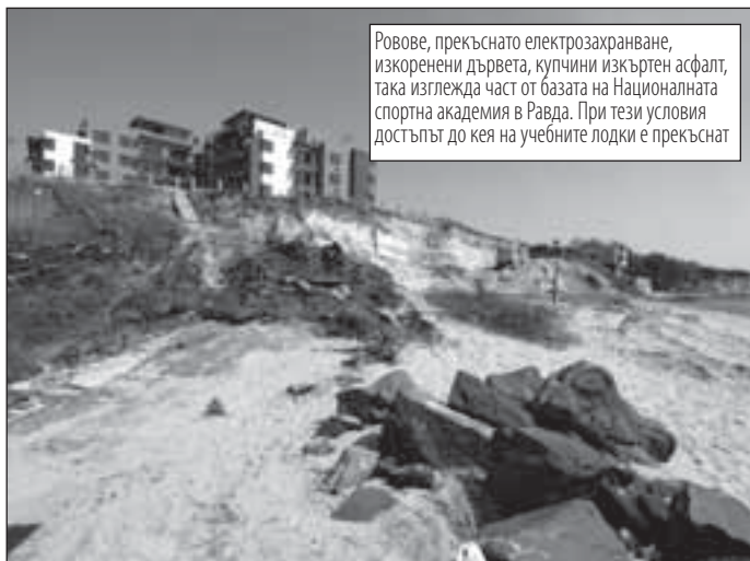
Ровове, прекъснато електрозахранване, изкоренени дървета, купчини изкъртен асфалт, така изглежда част от базата на Националната спортна академия в Равда. При тези условия достъпът до нея на учебните лодки е прекъснат