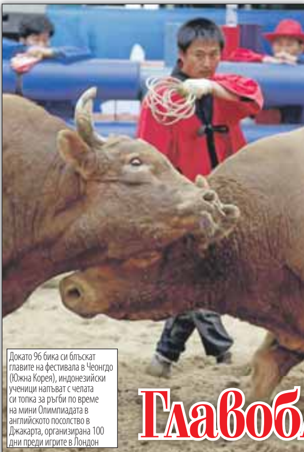
Докато 96 бика си блъскаат главите на фестивала в Чеонгдо (Южна Корея), индонезийски ученици напъват с челата си топка за ръгби по време на мини Олимпиадата в английското посолство в Джакарта, организирана 100 дни преди игрите в Лондон