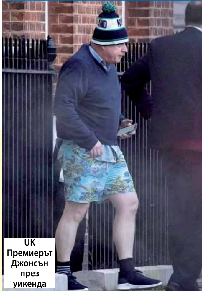
УК Премиерът Джонсън през уикенда

- Активен или пасивен? - В смисъл? - Ами, депутат ли сте или просто гледате телевизия?