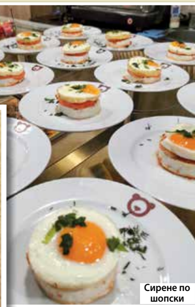
Сирене по шопски