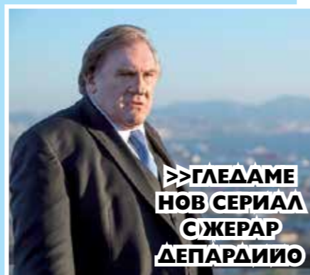
>> ГЛЕДАМЕ НОВ СЕРИАЛ С ЖЕРАР ДЕПАРДИО

торският състав включва още Том Хопър, Франк Грило и Алекс Петифър. На режисьорския стол сядат Кийрън Хоукс, а сценарият е поверен на Алесандро Камон. Сюжетът проследява преживяванията на Тайлър (Петифър) – бивш футболист, който се озовава зад решетките за убийство на наркодилър. В затвора той се сприятелява с Карпър (Грило), който ръководи престъпна група в Сан Куентин. Карпър подготвя Тайлър за бъдещ лидер на шайката бандити. Като такъв Тайлър ще има достъп до пари, за да вдигне мечтаната сватба с любимата си Лили (Бакалова). Снимачният процес на филма ще стартира през есента.