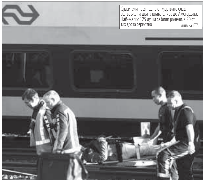
Спасители носят една от жертвите след сблъсъка на двата влака близо до Амстердам. Най-малко 125 души са били ранени, а 20 от тях доста сериозно