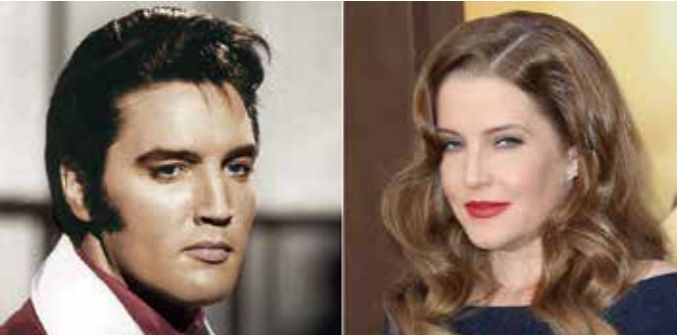
Лиза Мари Пресли е впечатляваща