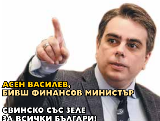
АСЕН ВАСИЛЕВ, БИВШ ФИНАНСОВ МИНИСТЪР