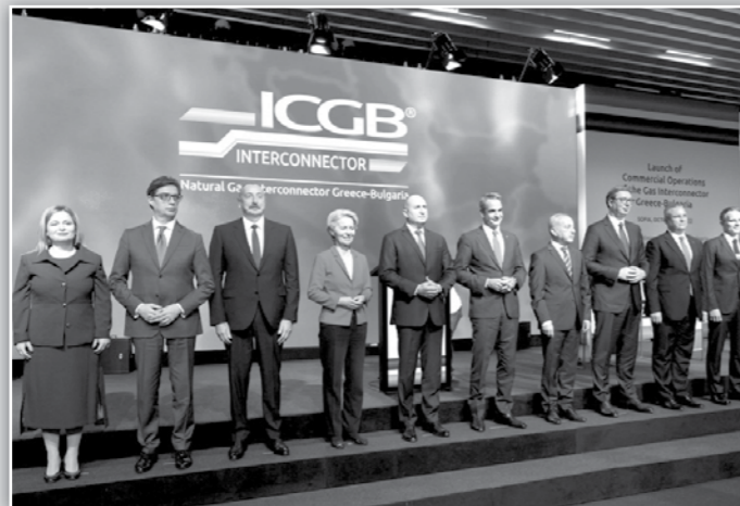
ICGB® Launch of Commercial Operation of the Gas Interconnector Greece-Bulgaria SOFIA, OCTOBER 1ST 2022

Президентът Алиев беше на двудневно посещение в България по повод официалното откриване на газовия ни интерконектор с Гърция, по който България ще получава