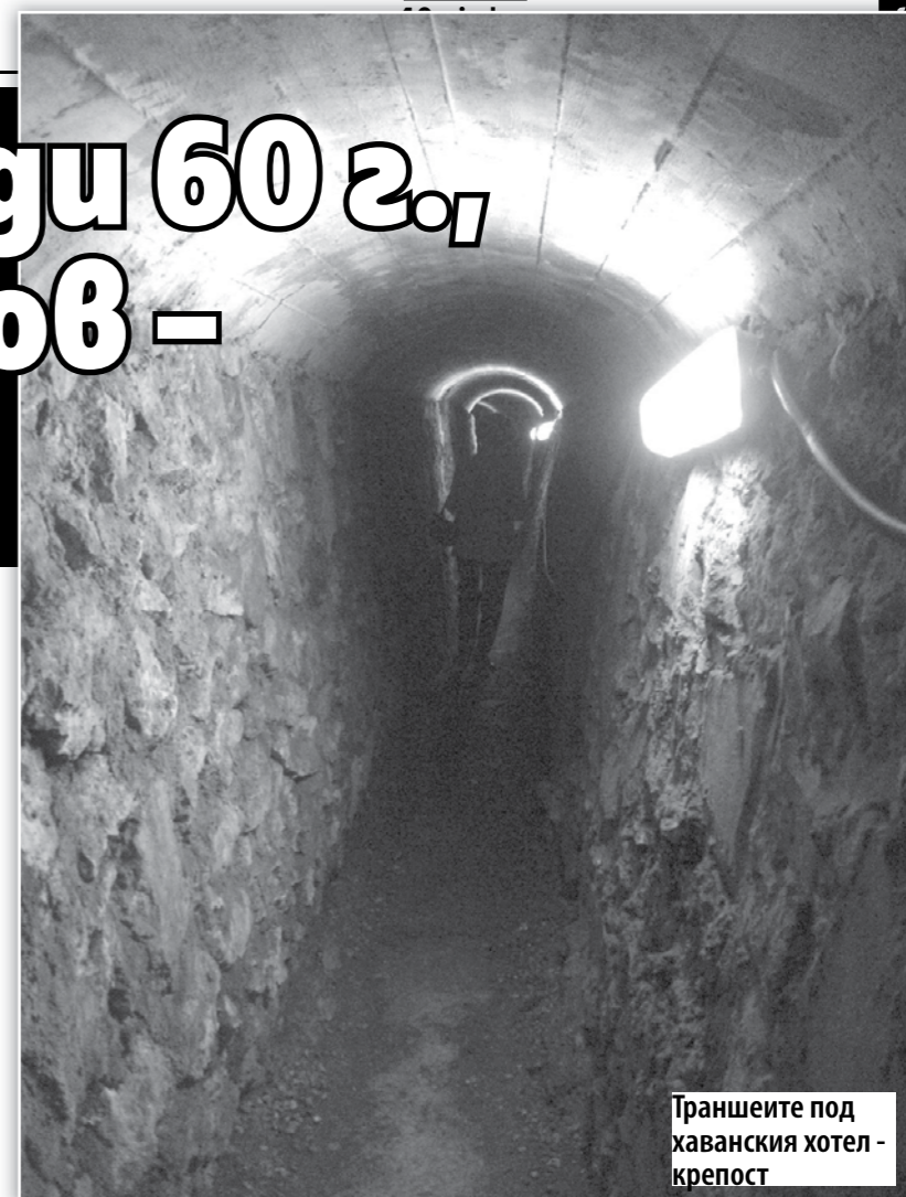
Траншеите под хаванския хотел - крепост

През 1964 г. след двуборцов преврат е отстранен от поста си