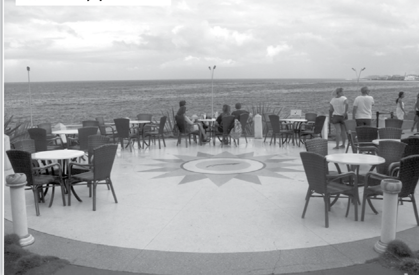
Градината на Насионал, под която са укрепленията

тия е била една от защитниците. Винаги разказите от първо лице на директни участници в нещо историческо са много по-вълнуващи от сухите хроники, така че личните спомени на запазената, въпреки годините си горда дама бяха наистина потапящи в онзи свят на Студената война, който през 2015 г., въпреки анексирането на Крим от Русия година по-рано, ми беше сложно да си представя, че може отново да стане реалност.