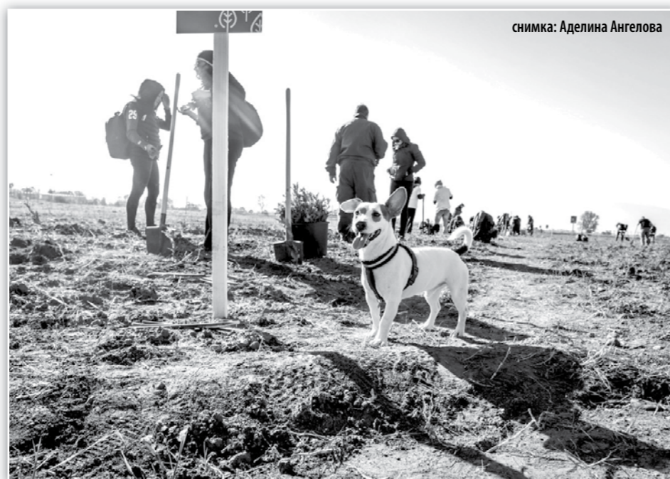
снимка: Аделина Ангелова

Благодаря на доброволците и дарители от магазини DM и банка ДСК, както и на нашите приятели от Лесотехническият университет в София, които засаждаха днес.